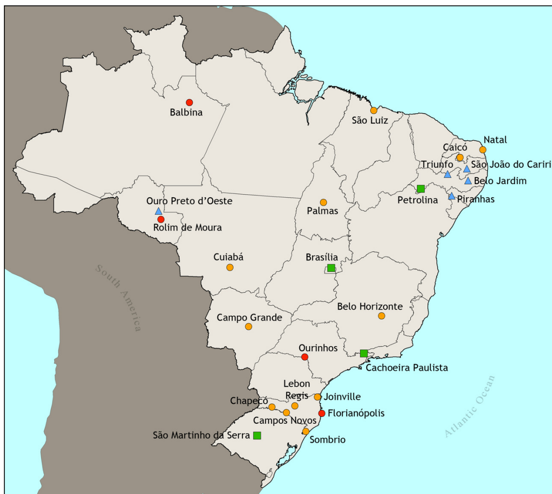
Figura 1 - Distribuição geográfica das estações da rede SONDA pelo território brasileiro.

A estação localizada em Florianópolis (SC) é uma das estações da rede SONDA que atende os padrões de qualidade para aquisição de dados estabelecidos pela Organização Mundial de Meteorologia (WMO) para a rede internacional BSRN (Baseline Solar Radiation Network). A estação está instalada no campus da Universidade Federal de Santa Catarina (UFSC) e é operada em parceria com o Laboratório de Energia Solar do Departamento de Engenharia Mecânica da UFSC – (27°36'S; 48°31'W). Os principais sensores instalados na estação SONDA em Florianópolis são: